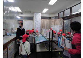
(地域センター見学の様子)

子どもたちは、「パソコンは何台ありますか？」や「職員の人は何人いますか？」などの質問をしながら見学しました。