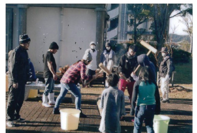
(餅つき大会の様子)

当アパートも昭和61年の建築から34年が経過し、建物や設備等の課題がいろいろと出てきていますが、今後も住みやすい環境づくりのため、皆様のご支援・ご協力をよろしくお願いいたします。