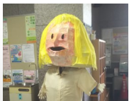
👉 ダイふれ君も待っています！

9月18日(金)には、ダイヤモンドふれあいセンターにおいても、ダイヤモンド地区の方を対象として「第1回ダイふれオンステージ」(演歌・歌謡コンサート、マジックショー)が開催されます。