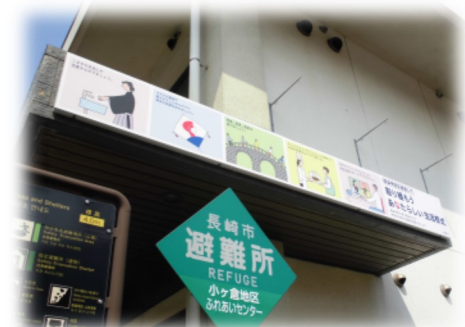
小ヶ倉合同庁舎の壁に、新しい生活様式を啓発する看板も設置されました！