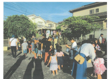
(夏祭りの「お化け屋敷」)

「高齢者サロン」では、グラウンドゴルフ、手芸、健康麻雀、カラオケ等を毎週行っています。また今年コロナの影響で子どもたちの思い出づくりの夏祭りは残念ながら中止しましたが、その中でも例年、お化け屋敷はいつも大盛況です。また地域の環境美化、清掃と、仲間作りをモットーとした地域活動クラブは自慢の団体です。