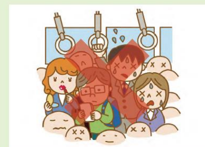
混んでいる時間は避ける