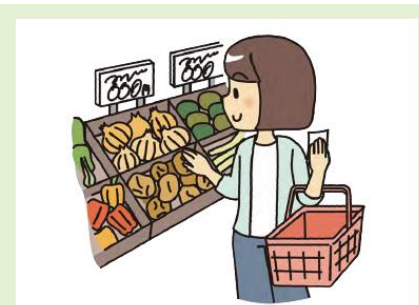
買い物は少人数で空いた時間に