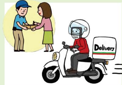
食事は出前やデリバリーを