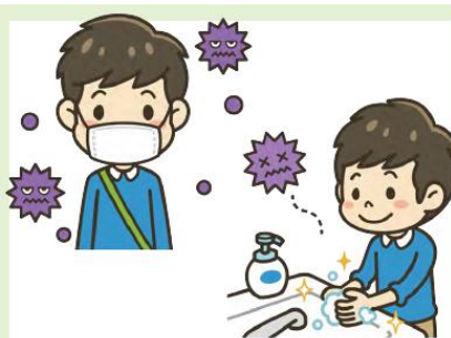
マスク着用・手洗い