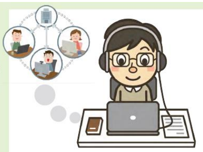
テレワーク、会議はオンライン