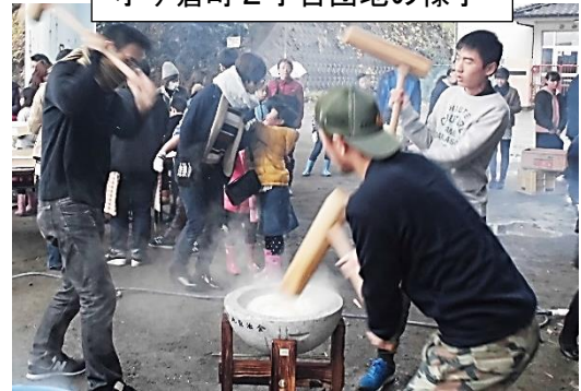
小ヶ倉町2丁目団地の様子

※延期した自治会もありました。（ダイヤモンド第2自治会→1/20、アパート自治会→12/22）