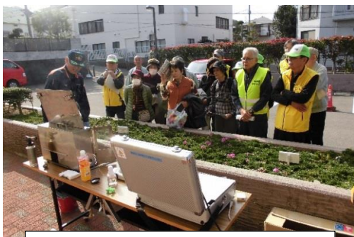
発火の実演を注視するみなさん

防災危機管理室による防災に関する講話のあと、消火器の扱い方・煙体験・発火の実演・AED取扱・非常食の炊き出し・ロープの取り扱いなどさまざまなブース、災害に関するパネル展示などを回り、楽しみながら防災意識を高めました。