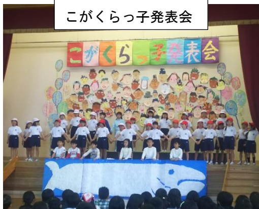
こがくらっ子発表会

また、12月7日(金)には、南長崎小学校にて「ふれあい人権集会」が行われ、各学級の目標や児童代表の発表のほか、学年毎にいじめや友情、インターネットトラブルなどをテーマにした発表が行われました。