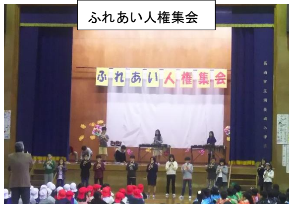
ふれあい人権集会