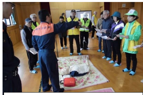
AED取扱の説明を受けるみなさん