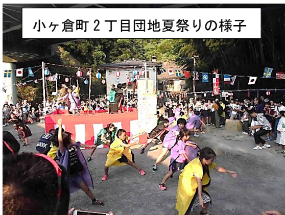
小ヶ倉町 2 丁目団地夏祭りの様子

当日は、朝早くから準備が行われ、まつりはそれぞれ夕方から開催されました。模擬店や、各団体による出し物、盆踊りなど、たくさんの人で大変賑わいました！！とても暑い中、準備から撤収まで、本当にお疲れさまでした！