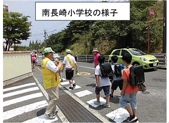
南長崎小学校の様子

小ヶ倉小学校は夜 7 時から、南長崎小学校は昼 12 時からパトロール及び集団下校が行われ、暑さが厳しい中、先生、地域住民など多くの方が参加し、子どもたちが安全に安心して過ごすことのできる住みよいまちづくりのために、力を集結しました。