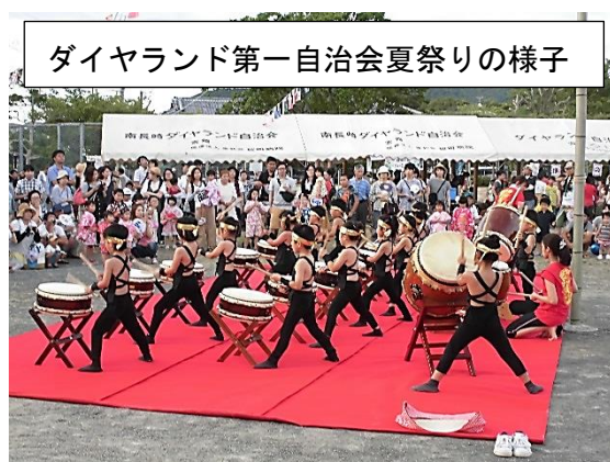
ダイヤモンド第一自治会夏祭りの様子