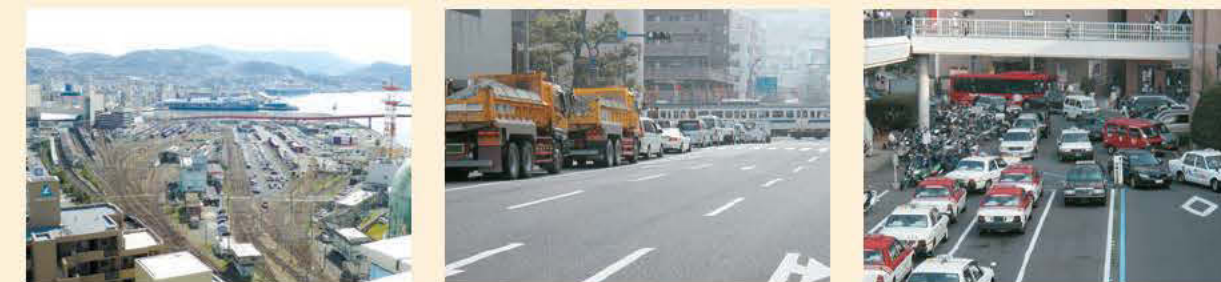
長崎駅周辺の現状 梁川橋踏切の混雑状況 駅前交通広場の現状