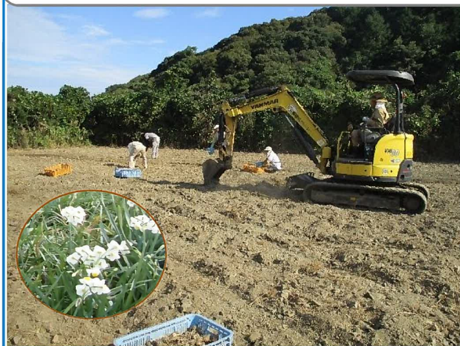
▲ 土を耕し、球根を一つ一つ植えていきます。

■野母崎の水仙について… 野母崎の水仙は、戦前から植えられてきた歴史があり、旧町役場とJA及び地域の生産者が一丸となって、県外への販売などに取組み、今では、「水仙の里野母崎・長崎水仙」として全国的にも人気のブランドです。