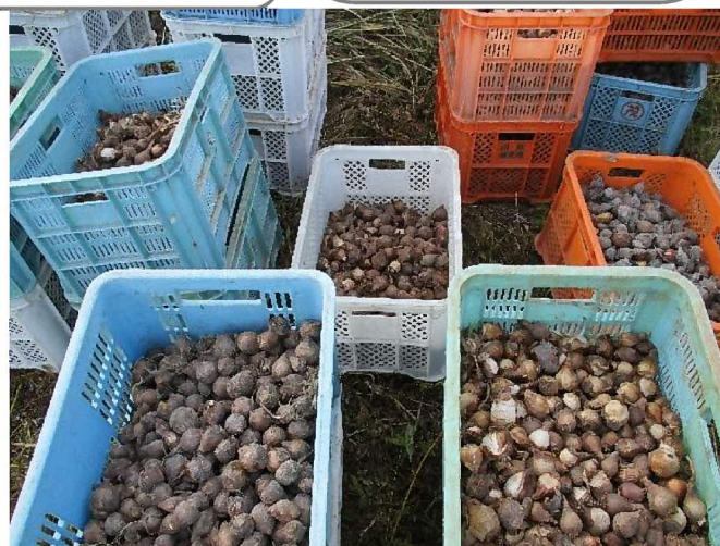
▲ たくさんのお水仙の球根