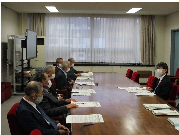
▲各地区の課題などの意見交換も行いました