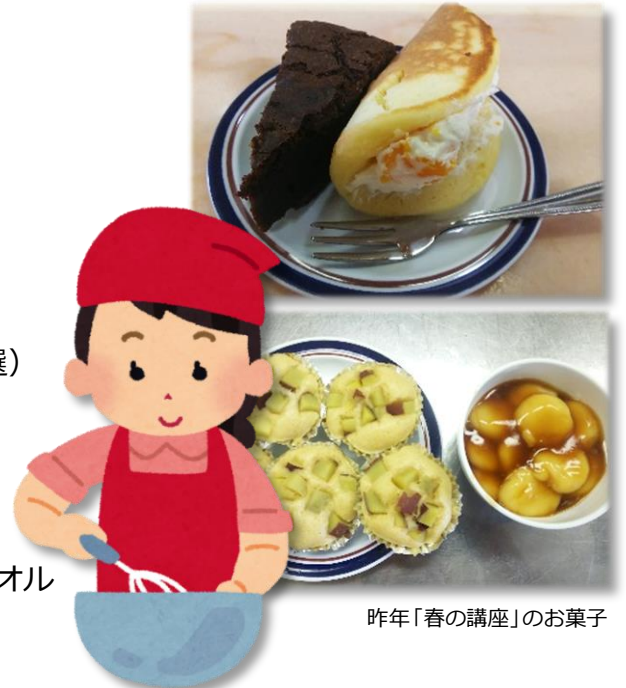
昨年「春の講座」のお菓子