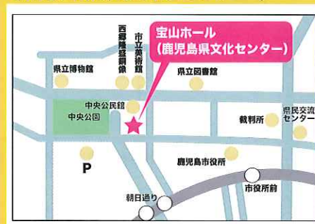
宝山ホール (鹿児島県文化センター)

J R熊本駅白川口(東口)正面 〒860-0047 熊本市西区春日1丁目14-1