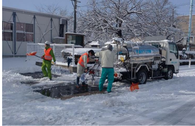
給水所での除雪作業(1/8)