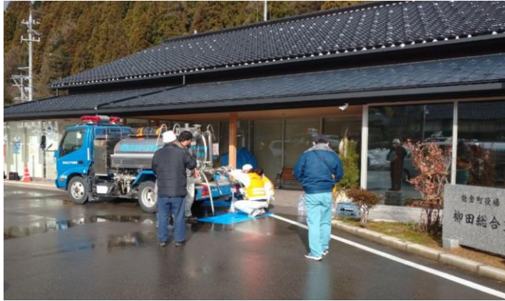
能登町柳田総合支所にて(1/7)