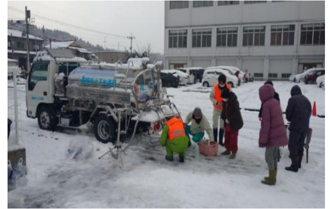
崎山山村開発センターにて(1/8~1/11)