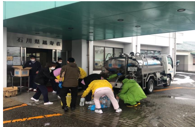
特別養護老人ホーム「石川県鳳寿荘」での補水作業(1/18~)