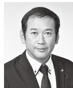
大石ふみき (日本共産党)