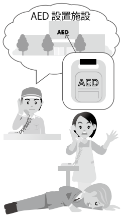
▲通報者に最寄のAED設置施設を案内

答 平成19年9月から、AEDの設置、救命講習の受講者が勤務しているなどの一定の要件を満たしているホテルや店舗などを救急サポートステーションとして認定し表示する制度に取り組んでいる。現在345施設を認定しているが今後も拡大に努めていきたい。また、神戸市が行っている、救急車を要請した通報者に最寄のAED設置施設の案内を行う等の取り組みは、AEDの早期使用や活用機会がふえるなど一人でも多くの命を救うためには有効な方法であることから、施設関係者の協力を得ながら同様の取り組みを行っていききたい。