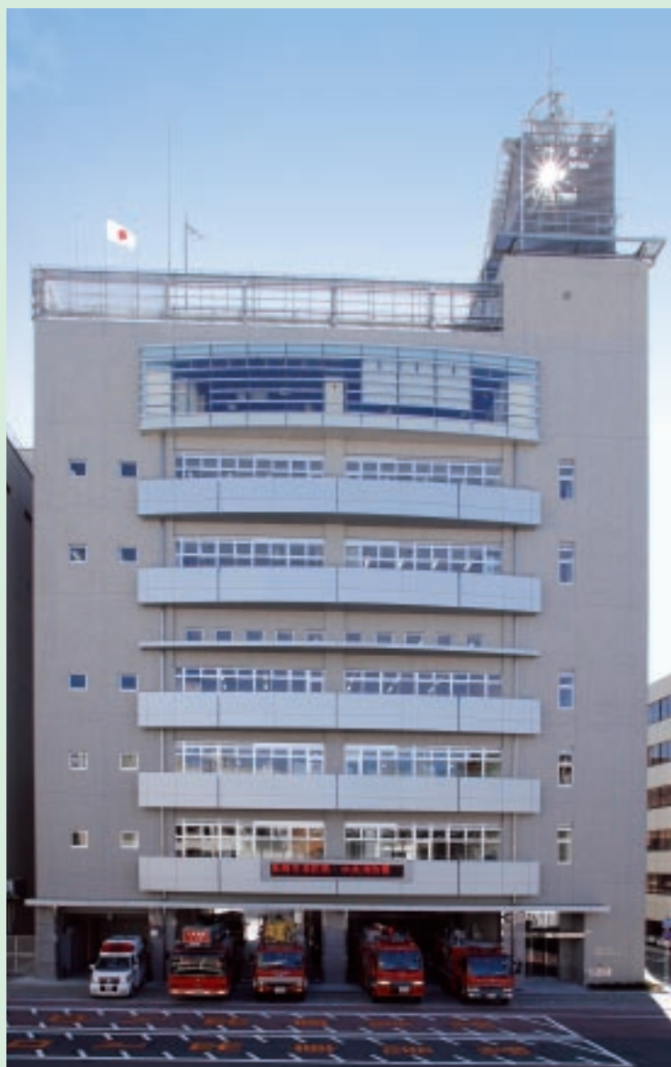
平成19年3月に完成した消防局・中央消防署新庁舎