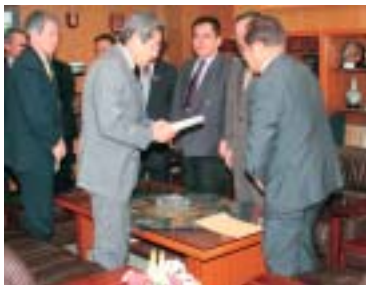
申し入れのようす (議長室)

公営住宅建設事業(滑石団地Ⅲ期工 事)において、工期内の完成が困難で あるにもかかわらず、3月議会への繰 越明許費計上の手続きが行われず、専 決処分による処理がなされたことを受 けて、今後、工事の請負契約の締結に あたっては、適正な工期の設定を行 入札の事前準備に努めるとともに、担 当部局での工事の進行管理を徹底し、工 期の変更等 を要する場 合は、関係 部局と協議 のうえ、適 切かつ迅速 に処理する よう、市長 に対し申し 入れました。