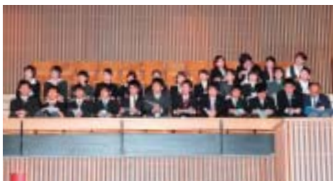
新規採用職員の傍聴のようす

公務に対する幅広い知識 を身に付ける ことを目的と して、平成18 年度長崎市新 規採用職員の 本会議傍聴研 修が実施され ました。